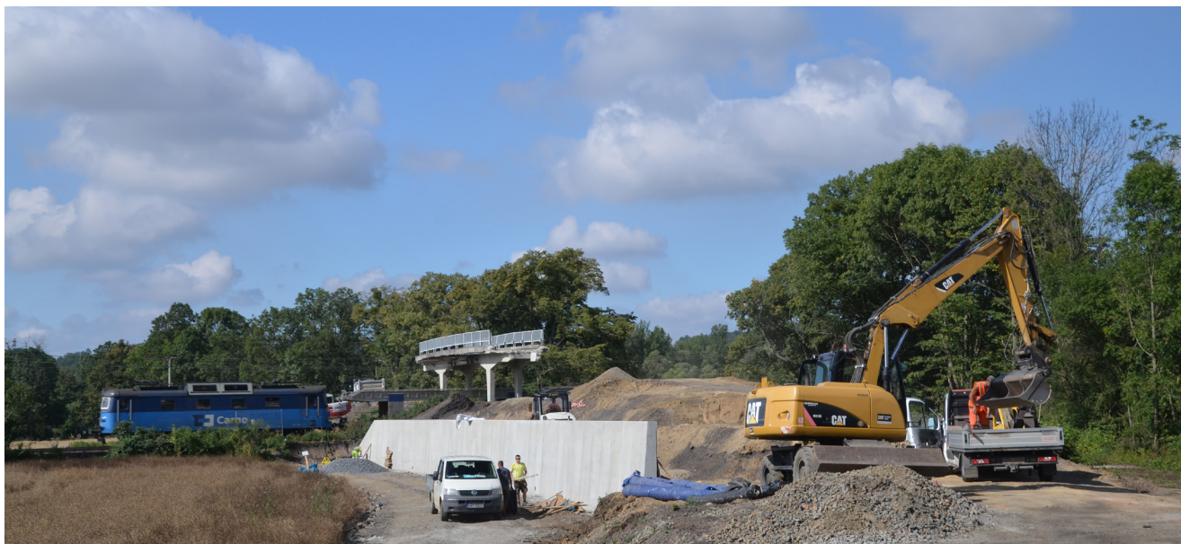
01 — V rámci stavby se postaví i nové mosty a mimoúrovňová křížení železnice a silnice 02 — Železniční stanice projdou rekonstrukcí, vybudují se nová, bezbariérově přístupná nástupiště

Zvýšení traťové rychlosti až na 160 km/h přinese rekonstrukce traťového úseku Valašské Meziříčí – Hustopeče nad Bečvou na pomezí Zlínského a Olomouckého kraje. Výraznou proměnou projde zejména stanice Lhotka nad Bečvou včetně výpravní budovy. Během stavebních prací se opraví železniční spodek a svršek, trakční vedení i zabezpečovací zařízení. Rekonstruovány budou všechny železniční mosty a propustky, část propustků bude zrušena. Součástí stavby je i příprava na dálkové ovládání zabezpečovacího zařízení z Centrálního dispečerského pracoviště Přerov. Projekt bude spolufinancovaný EU z programu Nástroj Evropské unie pro propojení Evropy (CEF).