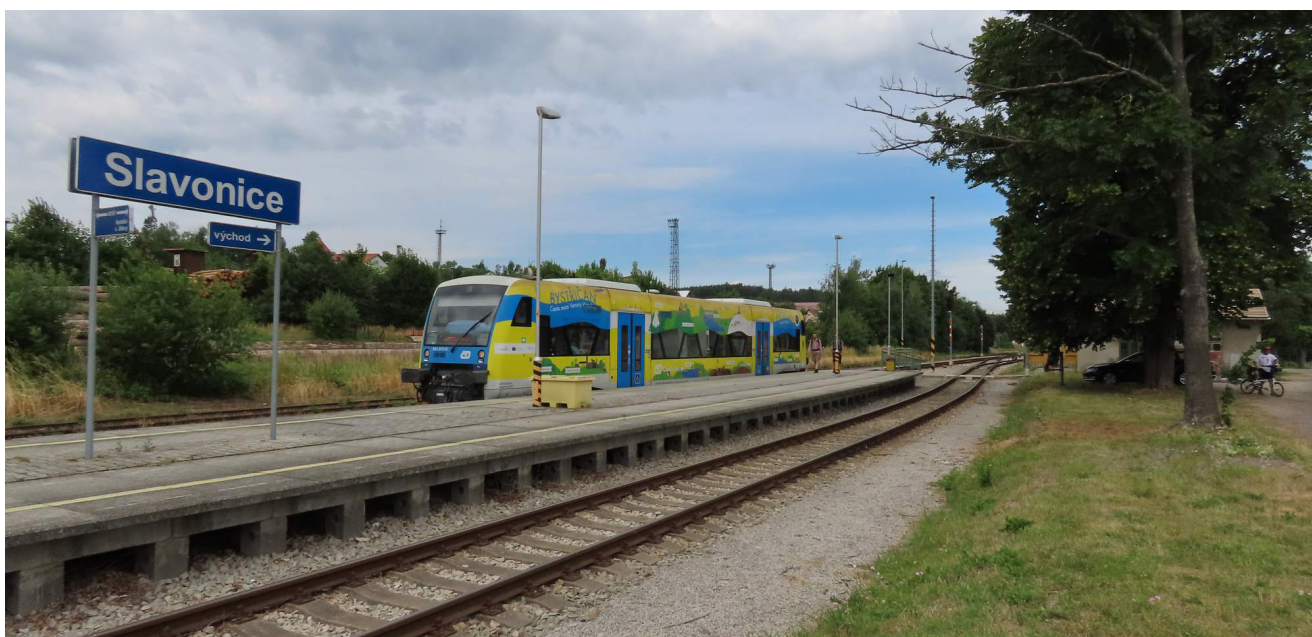
01 — Slavonice jsou konečnou stanicí regionální trati z Kotelce u Jihlavy, leží téměř na česko-rakouské hranici

Základním účelem stavby je revitalizace dráhy, zefektivnění jejího provozu a zajištění dostatečné kapacity trati pro vedení vlaků v osobní a nákladní dopravě. Současná i výhledová kapacita této trati bude stanovena na základě zpracované a projednané dopravní technologie, zohledněn bude závazný krátkodobý i střednědobý výhled objednávky regionální železniční dopravy zajišťované Krajem Vysočina. Účelem stavby je rovněž zvýšení bezpečnosti dopravy. To se dotýká jak drážního provozu (nasazení zabezpečovacího zařízení 3. kategorie), tak silniční dopravy. Zvýšený komfort cestujícím poskytnou nově vybudovaná nástupiště.