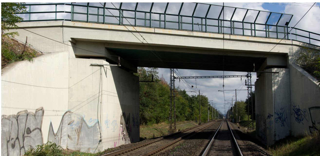
01 — Dnešní mimoúrovňové křížení dvou hlavních tratí by měla po realizaci projektu doplnit Hlízovská spojka

Základními cíli stavby jsou zvýšení traťové rychlosti podle možností daných územními poměry a zástavbou, zkrácení jízdních dob vlaků, zvýšení spolehlivosti a bezpečnosti železničního provozu a rekonstrukce již zastaralých stavebních a technologických částí. Projekt počítá také s vybudováním nové Hlízovské spojky, díky které se odstraní kolize vlaků ve směru Praha – Kolín – Kutná Hora s vlaky ve směru Pardubice – Kolín – Praha, k níž dnes dochází na tzv. velimském zhlaví železniční stanice Kolín. Tato kolize velmi negativně ovlivňuje kapacitu značně zatížené trati a má za následek i přenášení zpoždění mezi vlaky.