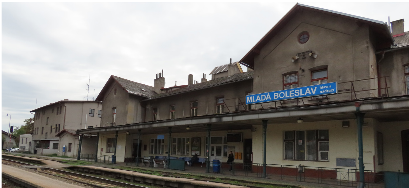
01 — Dnešní výpravní budovu na mladoboleslavském hlavním nádraží čeká demolice, nahradí ji nový multifunkční objekt

Předmětem projektu je demolice současné výpravní budovy na mladoboleslavském hlavním nádraží a výstavba nového objektu, jehož součástí budou regionální dispečerské pracoviště, odbavovací hala, zázemí pro dopravce, komerční jednotky a veřejné toalety. V rámci stavebních prací proběhne i rekonstrukce přilehlých prostor v těsné blízkosti výpravní budovy, kde vzniknou mimo jiné i nová parkovací místa, která budou sloužit zaměstnancům zajišťujícím provoz železniční stanice. Další úpravy přednádražního prostoru chystá následně i město Mladá Boleslav. Architektonická podoba nového objektu výpravní budovy bude výsledkem spolupráce investora s městem.