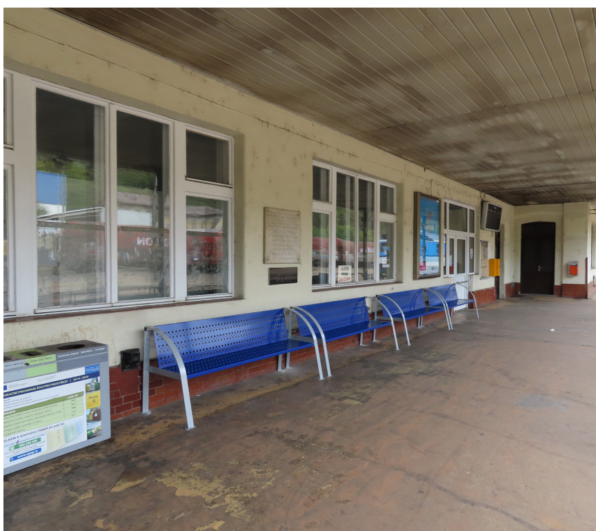
02 — V nové budově bude cestujícím k dispozici moderní zázemí, včetně mobiliáře a informačního i orientačního systému